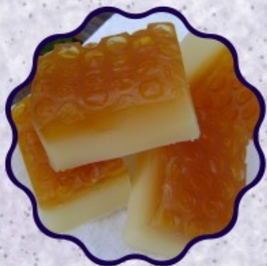
- SABONETE FAVO DE MEL