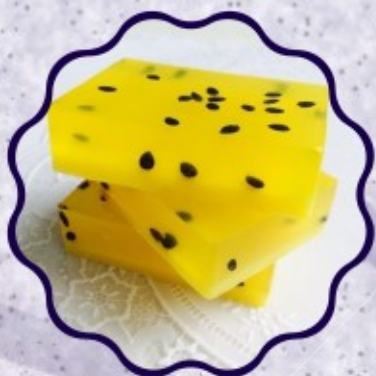
- SABONETE DE MARACUJÁ