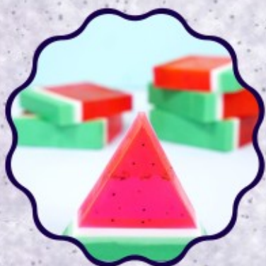
- SABONETE DE MELANCIA