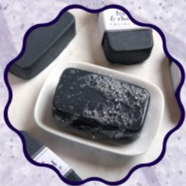
- SABONETE FACIAL DE CARVÃO