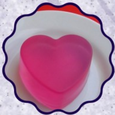
- SABONETE CORAÇÃO